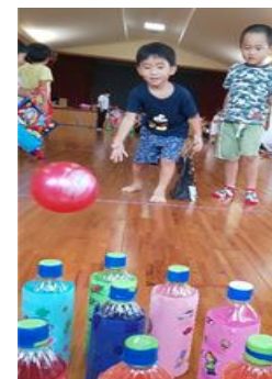
(ボーリングをやったよ!)