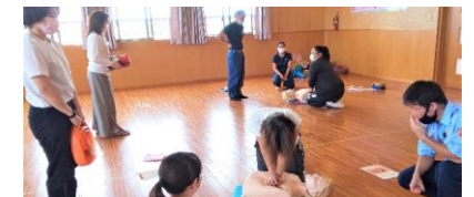
(救急救命・AED研修会の様子)